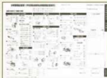
自家用乗用車の点検整備(分解整備)記録簿

これはいわば、クルマの健康カルテ。エンジンやブレーキをはじめ、さまざまな箇所の点検・整備の内容が記録されています。